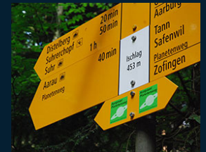
Astronomische Vereinigung Aarau